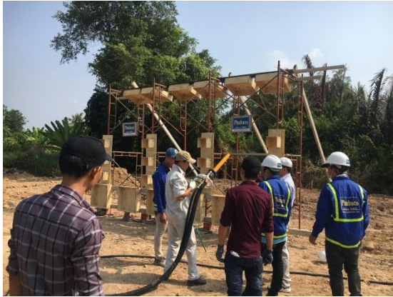
Hình : Sơ đồ thực nghiệm