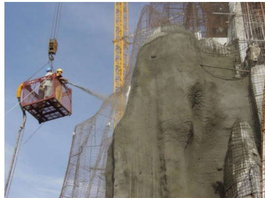
Hình : Phun bê tông mái dốc