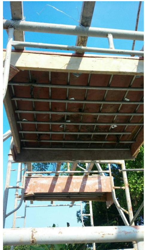
Hình : mẫu phun có thép