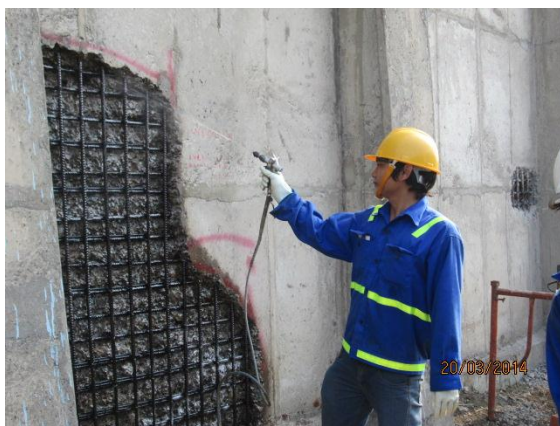
Hình : tái lập tường bê tông