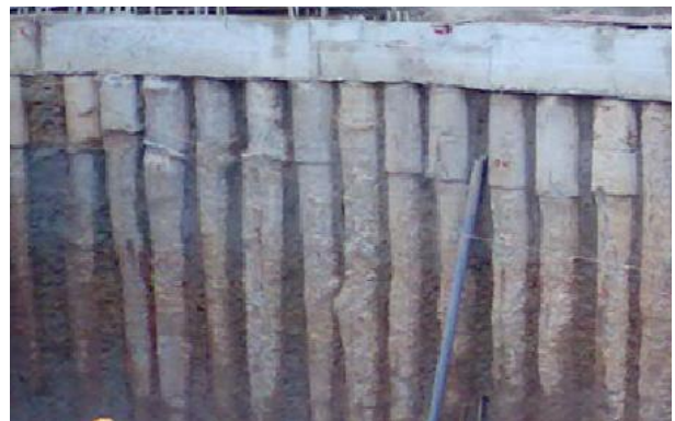
Hình : Khe hở giữa 2 cọc tường vây