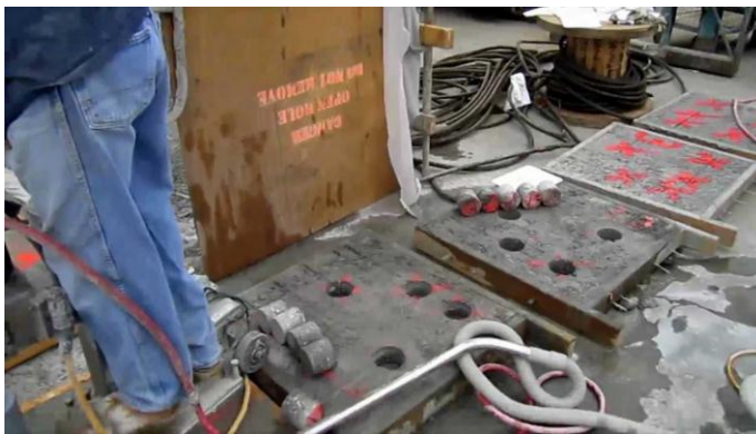
Hình : Khoan lỗ thử chất lượng